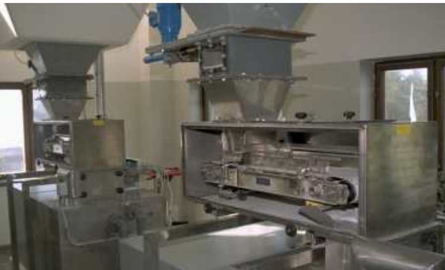
För mindre materialmängder finns färdiga kompletta transportör-lösningar i flera standardvarianter, även inkapslade och i rostfritt.