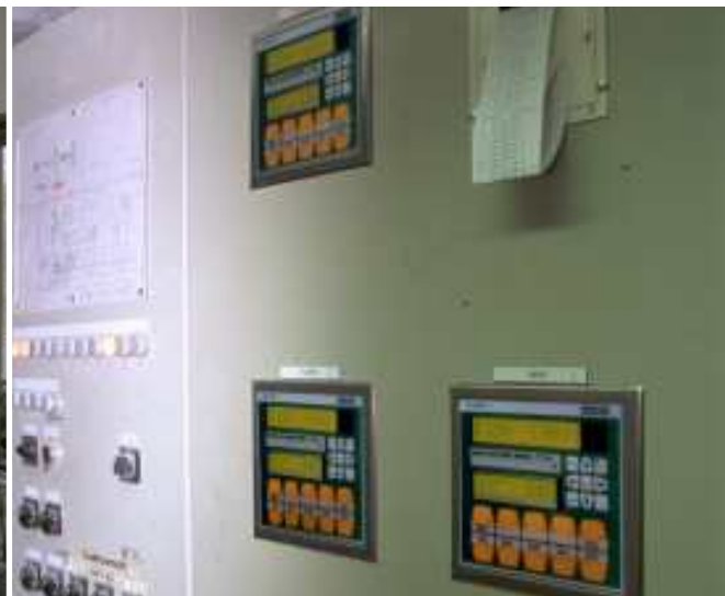
Instrumenten SYSTEM T eller Z är bandvågens mät- och styrcentral med industriell design och enkel hantering.