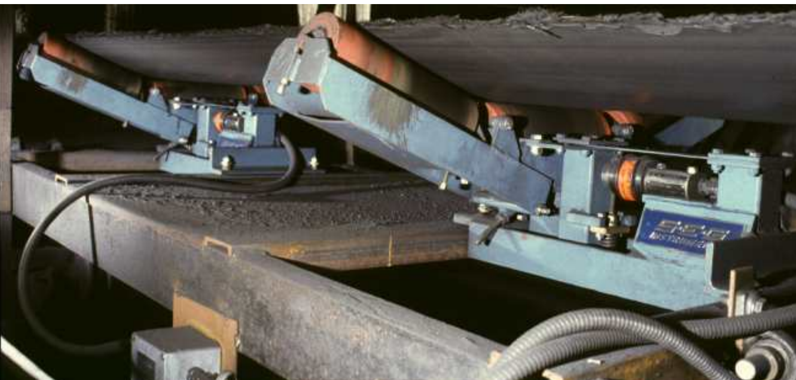
Våginstitutionen anpassas till noggrannhetskraven, från precisionsmätning till enklare flöden.