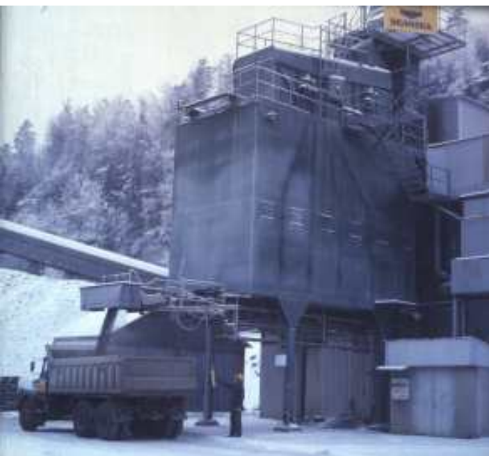
Utleveranser sker vanligtvis i fastställda kvantiteter och verifieras med leveranssedlar etc.