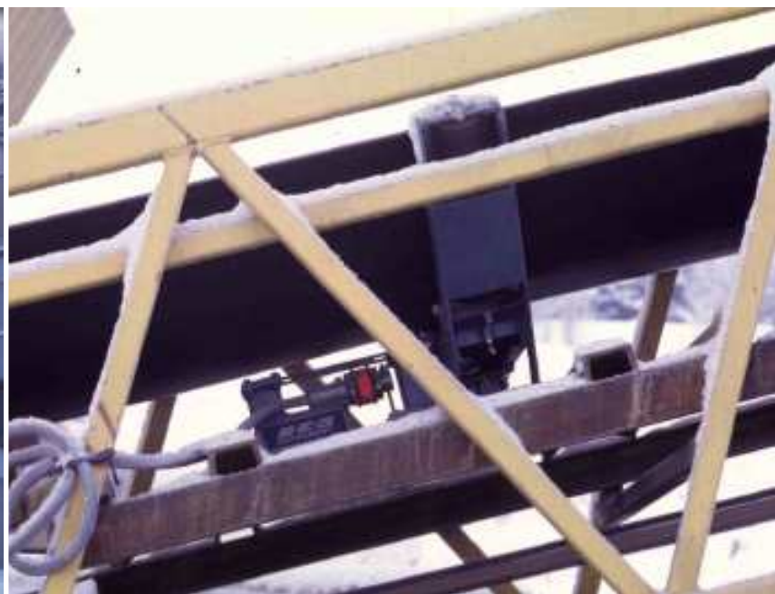
Vågdonen passar i alla vanliga transportörer. Installation sker med minimala driftavbrott.